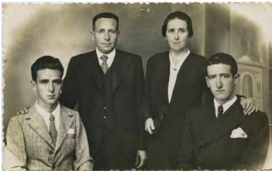
Figura 14. Retrato de la familia Galindo Saura (1941).

• Vida civil , con las fotografías familiares que aportan un conocimiento más cercano a su persona, su familia, su tierra y su mundo.