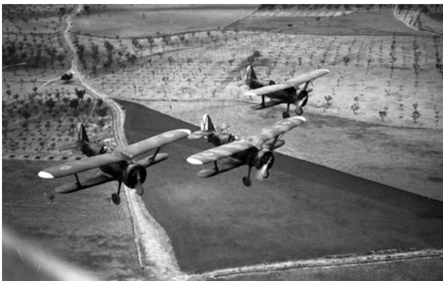
Figura 4. Cazas Polikarpov I-15 «Chatos» soviéticos reutilizados por el Ejército del Aire después de la guerra civil (hacia 1940).

que le habilitaba ya para pilotar aviones de caza, y en mayo de 1937 obtuvo el definitivo título de Piloto Militar de aeroplano. Desde sus primeros vuelos tuvo que familiarizarse con los aviones Polikarpov I-15, llamados popularmente Chatos. Estos biplanos, sólidos y compactos pero de gran maniobrabilidad, eran suministrados por el ejército soviético al bando republicano, y llegaron a convertirse en un símbolo de su Aviación.