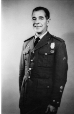
Figura 15. Julio Salvador Díaz-Benjumea, coronel director de la Academia General del Aire de San Javier (1954).

Se trataba de Julio Salvador Díaz-Benjumea, ascendido a coronel director de la Academia, pero en 1939, piloto del bando nacional canjeado por Galindo en el puente de Irún.