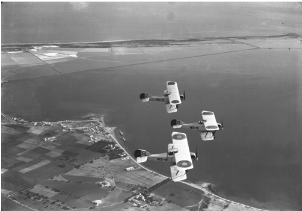
Figura 2. Grupo de aviones Martynside sobrevolando el Mar Menor (1934).