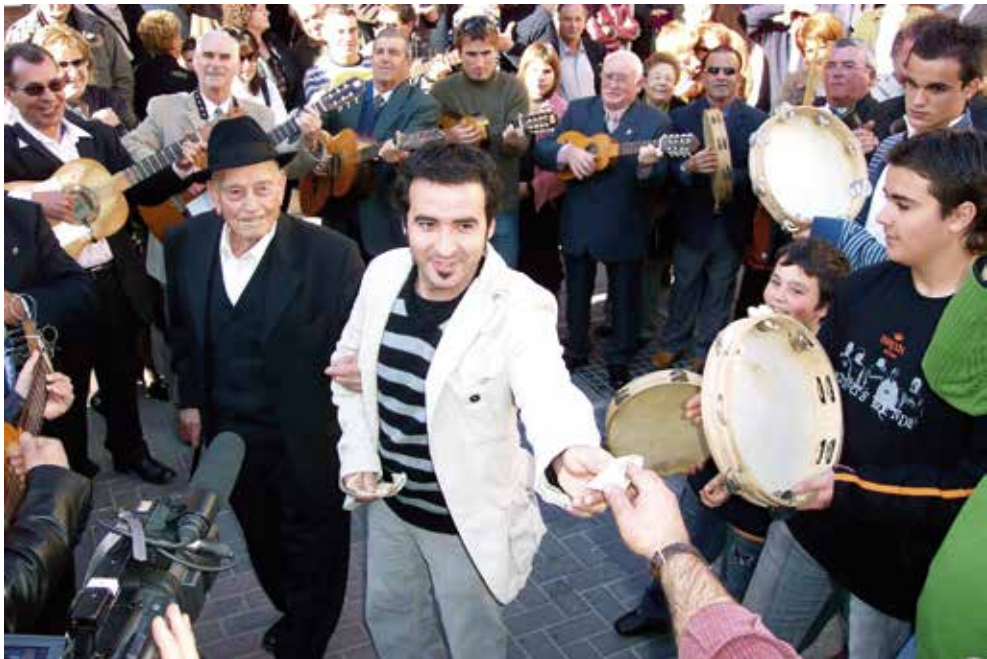
Aledo. 2006