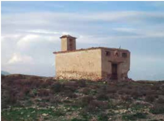
Ermita de Torralba (Lorca) Tomás García Martínez, 2015